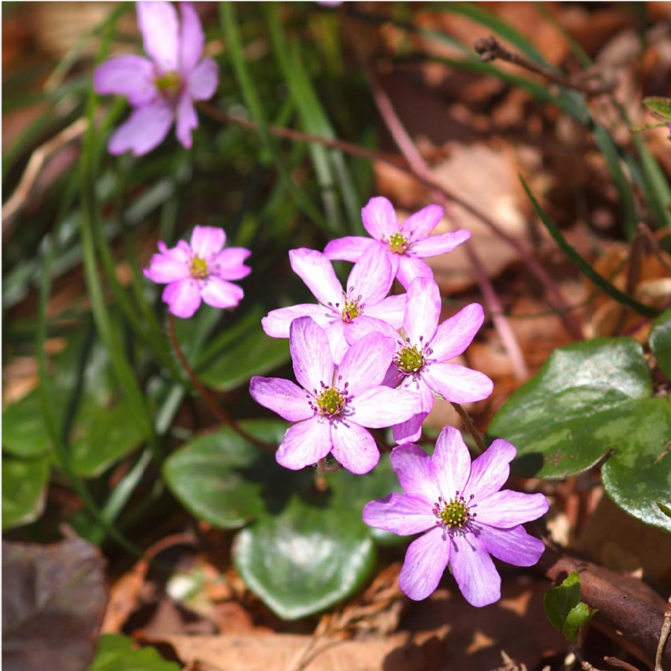
大三角草 (オオミスミソウ) Hepatica nobilis (Liverleaf)