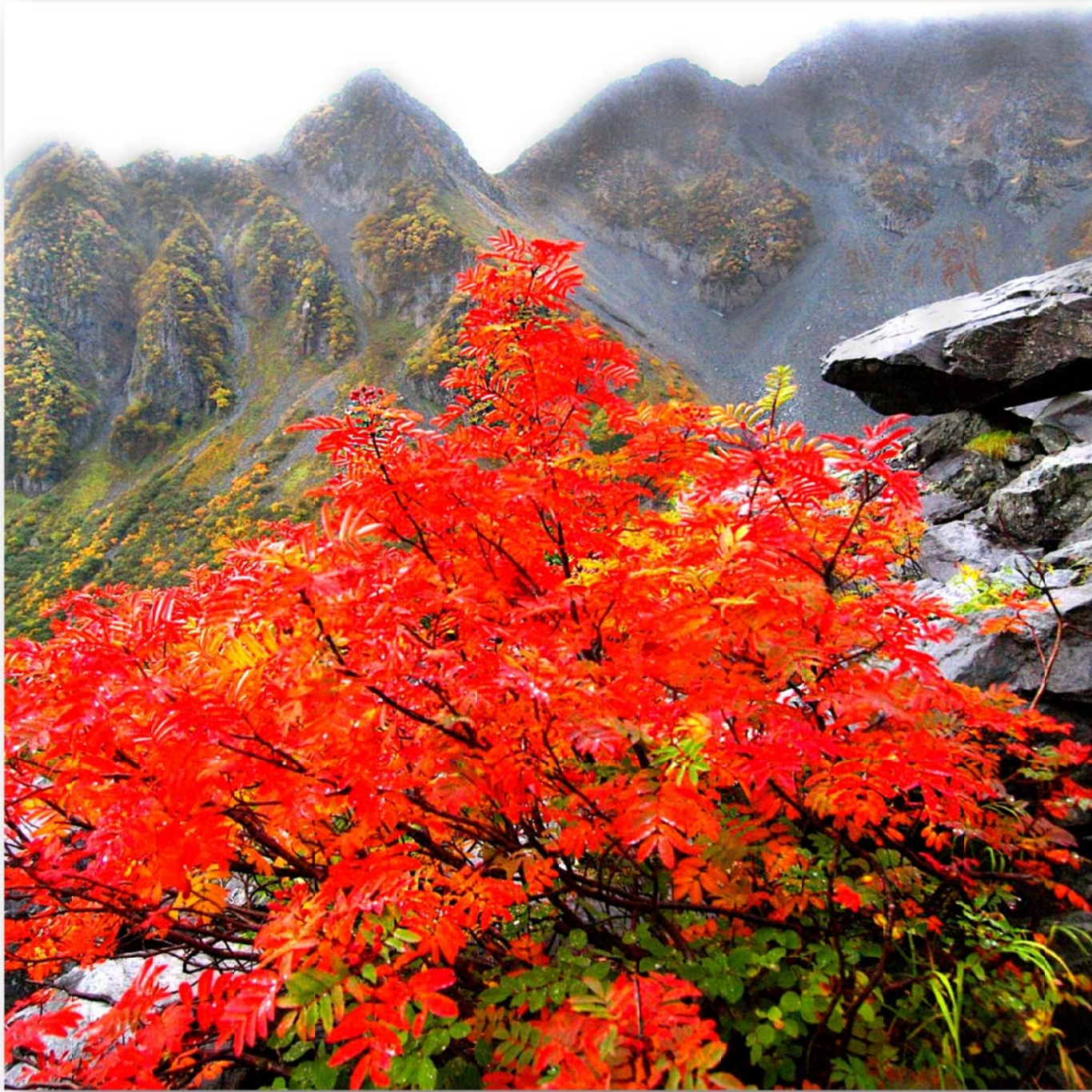
七竈 (ナナカマド) Sorbus commixta (Japanese rowan)