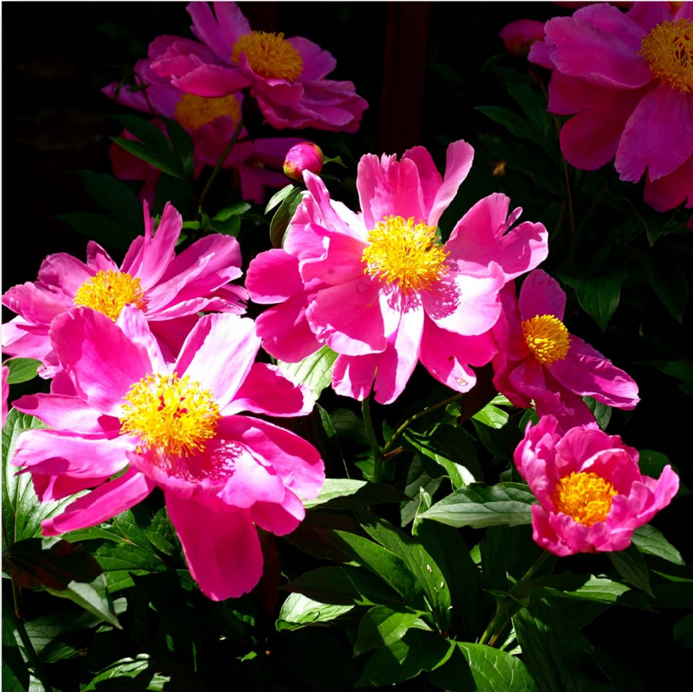
芍薬 (シャクヤク) Paeonia lactiflora (Chinese peony)