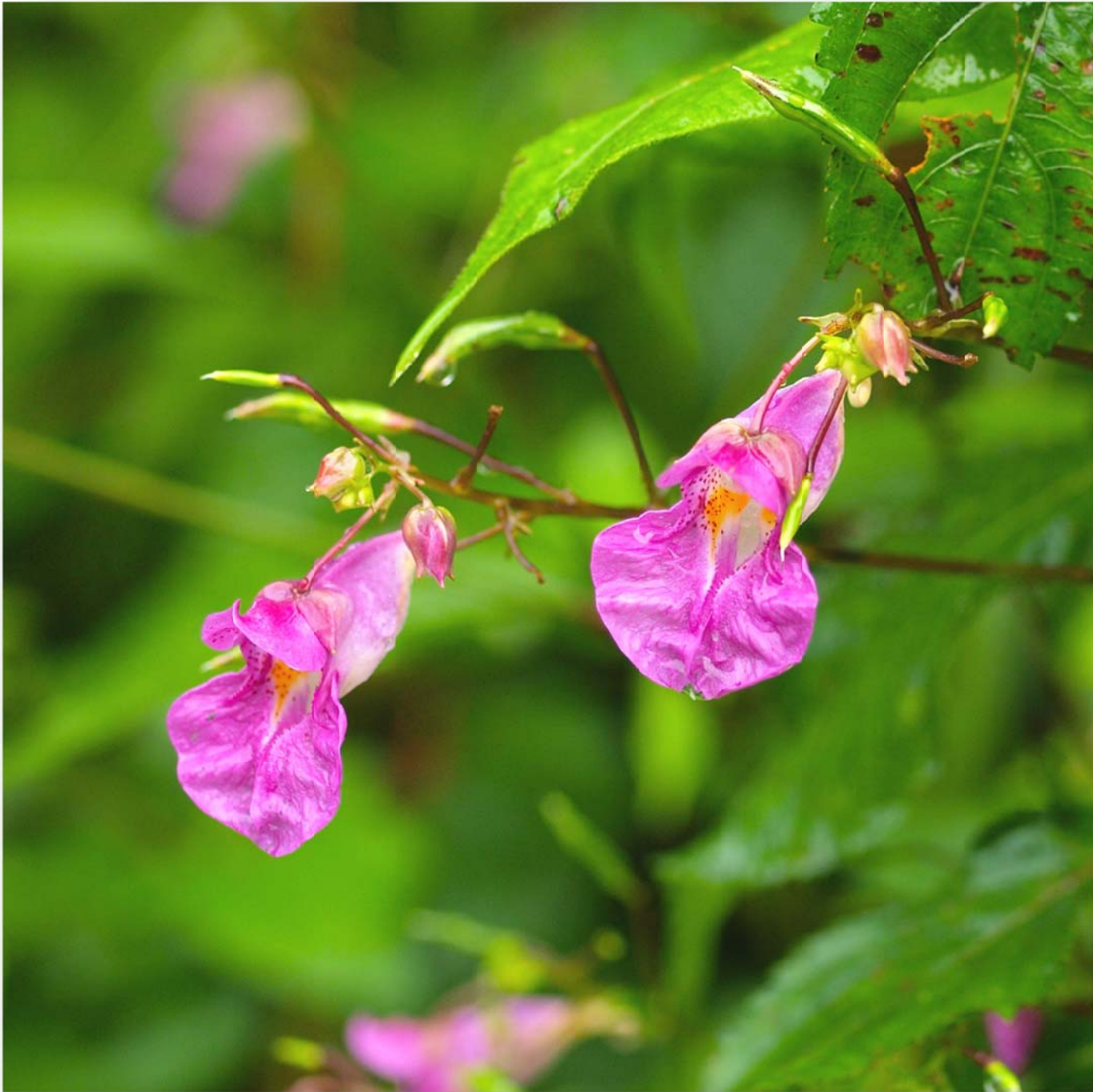
釣船草 (ツリフネソウ) Impatiens textorii (Touch-me-not)