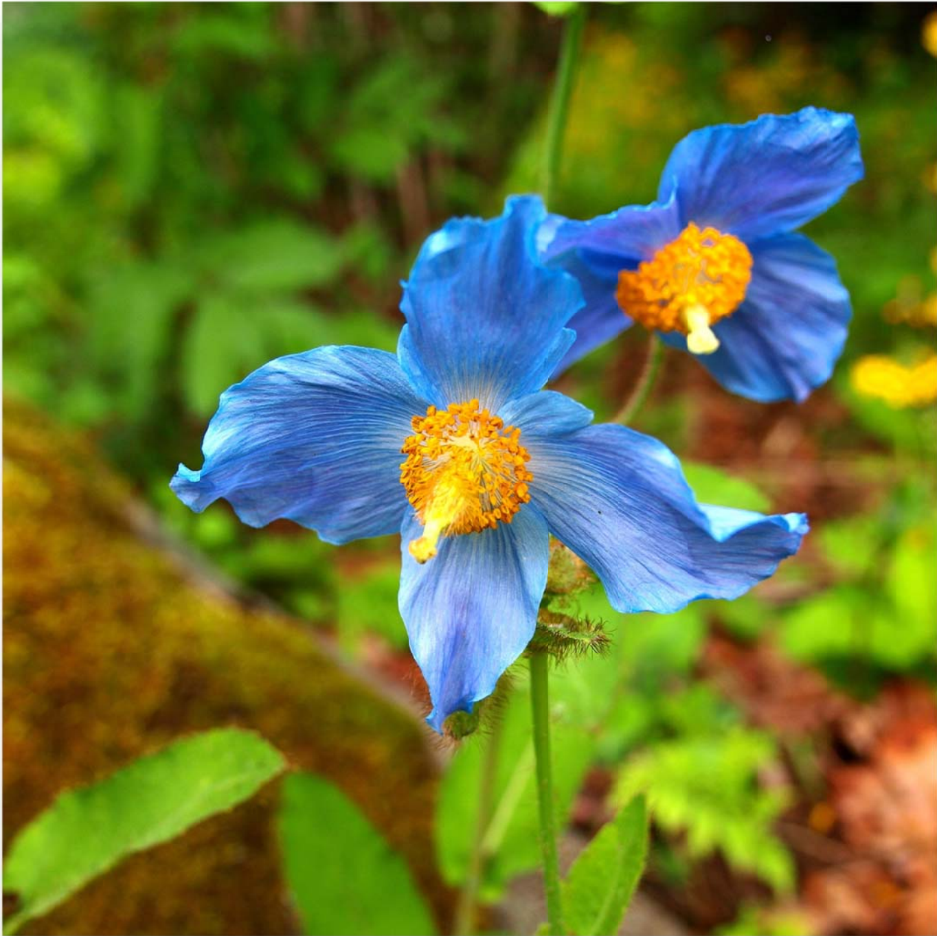
青いケシ (メコノプシス・ バイレイ) Meconopsis baileyi (Himalayan poppy)