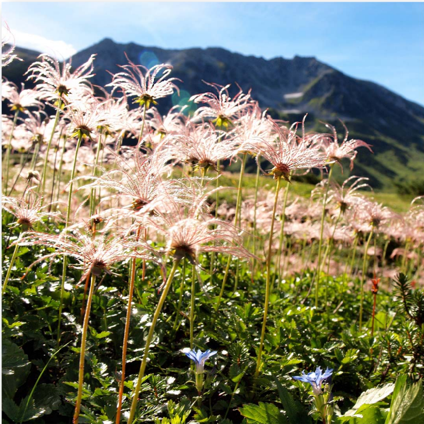
稚児車 (チングルマ) Geum pentapetalum (Aleutian avens)