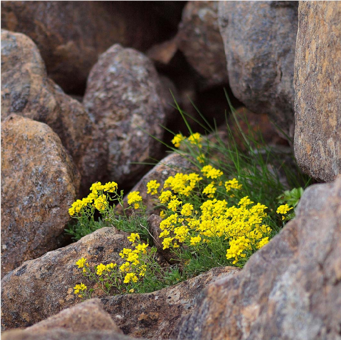
南部犬薺 (ナンブイヌナズナ) Draba japonica (Whitlow-grasses)