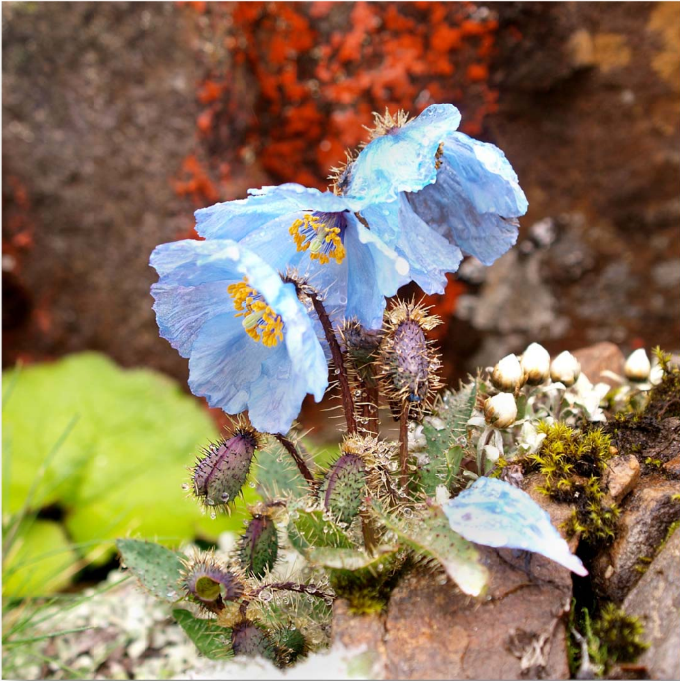
青いケシ (メコノプシス ホリデュラ) Meconopsis horridula (Prickly Blue poppy )