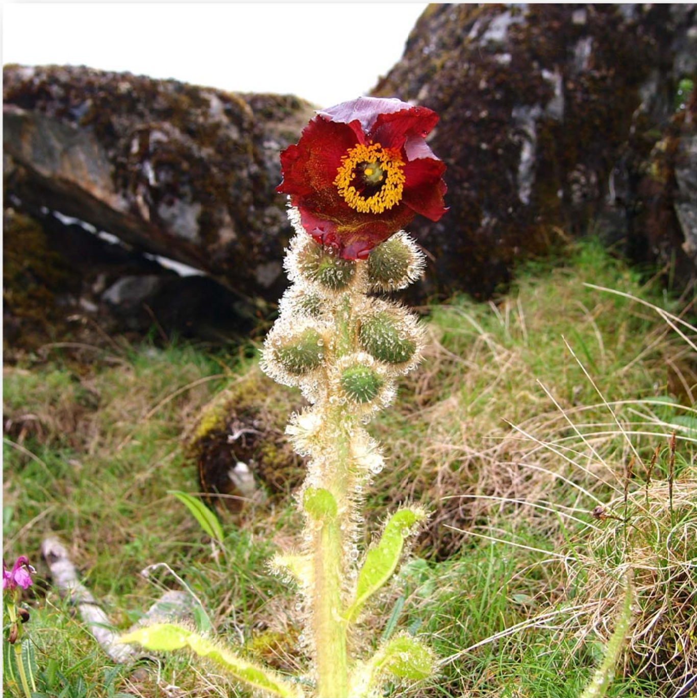
青いケシ (メコノプシス・チベチカ) Meconopsis tibetica (Tibetan poppy)