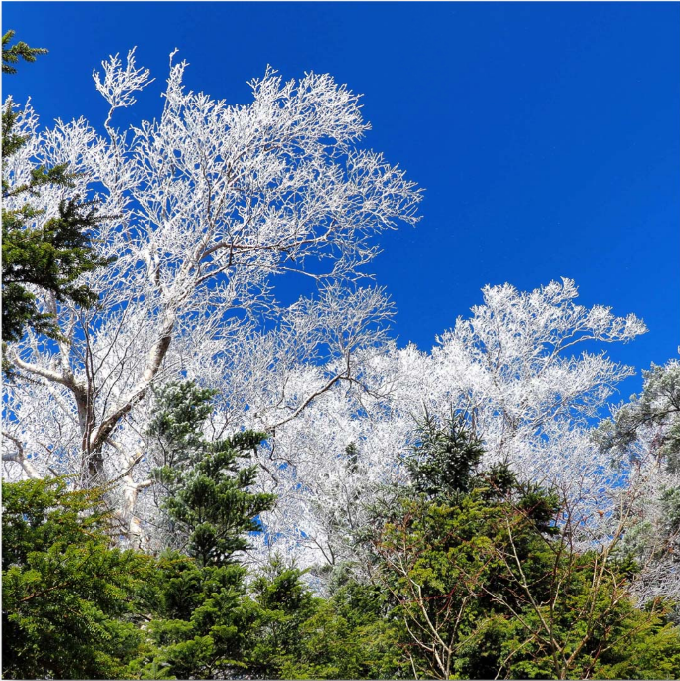
岳樺 (ダケカンバ) Betula ermanii (Gold birch)