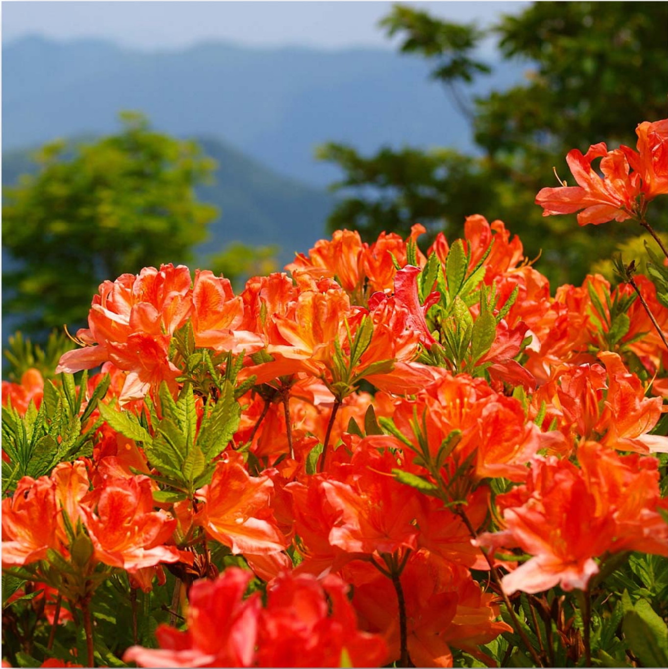
蓮華躑躅 (レンゲツツジ) Rhododendron japonicum (Japanese azalea)