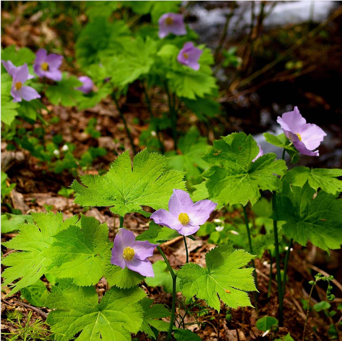
白根葵 (シラネアオイ) Glaucidium palmatum (Japanese Wood Poppy)